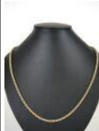
663. Collier en or jaune 18K à maille torsadée parcouru d'une chaînette à maille forçat en or gris 18K. Poids : 15,5 g. L. 50 cm.