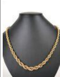
662. Collier en or jaune 18K à maille torsadée. Avec chaînette de sécurité. Poids : 19 g. L. 48,5 cm.