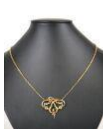
653. Collier en or jaune 18K composé d'une chaîne à maille forçat agrémentée d'un pendentif à décor de branchage rubané orné de quatre petites perles et deux petits éclats de rose montés en serti-clos. Fin XIXe. Poids brut : 7,9 g. 2,5 x 3 cm. (un accident au nœud de ruban, manque une perle en pendeloque).