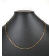
651. Chaîne de cou en or jaune 18K à maille rectangulaire. Poids : 3,9 g. L. 40 cm.