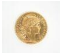
450. Pièce de 20 francs en or, Marianne, 1914. 300 / 350 €