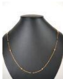
656. Collier en or jaune 18K à maille ovale rythmé de boules et maillons ajourés. Poids : 4,4 g. L. 48,5 cm.