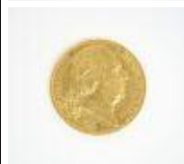
461. Pièce de 20 francs en or, Louis XVIII Roi de France, 1817 W. 300 / 400 €