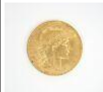
457. Pièce de 20 francs en or, Marianne, 1906. 300 / 400 €