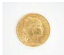
453. Pièce de 20 francs en or, Marianne, 1913. 300 / 350 €