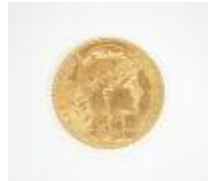
451. Pièce de 20 francs en or, Marianne, 1910. 300 / 350 €