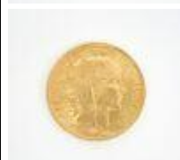
465. Pièce de 20 francs en or, Marianne, 1907. 300 / 350 €