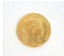
452. Pièce de 20 francs en or, Marianne, 1909. 300 / 350 €