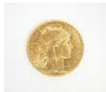
446. Pièce de 20 francs en or, Marianne, 1911. 300 / 350 €