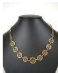
659. Collier en or jaune 18K à maille filigranée. Poids : 15,1 g. L. 39 cm. (un maillon accidenté).