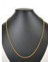
652. Collier en or jaune 18K à maille annulaire, le fermoir rectangulaire. Poids : 16,4 g. L. 67 cm.