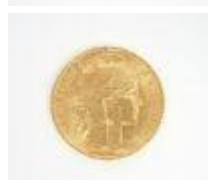
455. Pièce de 20 francs en or, Marianne, 1907. 300 / 350 €