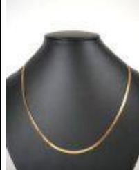
660. Fin collier plat en or jaune 18K. Poids : 4,4 g. L. 42 cm. (à nettoyer).