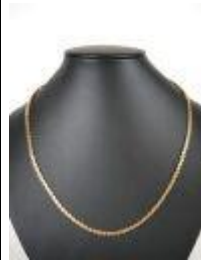
657. Collier en or jaune 18K à maille stylisée à décor de volutes stylisées. Poids : 25,4 g. L. 55 cm.