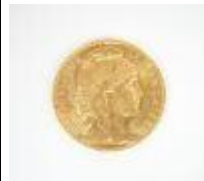
463. Pièce de 20 francs en or, Marianne, 1911. 300 / 350 €