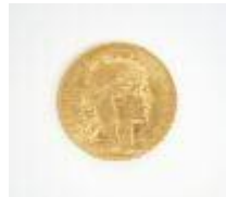
448. Pièce de 20 francs en or, Marianne, 1907. 300 / 350 €