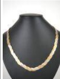
661. Collier en or jaune, or gris et or rose 18K à maille tressée aplatie. Poids : 24 g. L. 45,5 cm.