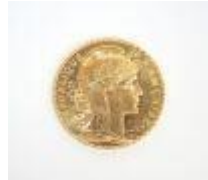
447. Pièce de 20 francs en or, Marianne, 1914. 300 / 350 €