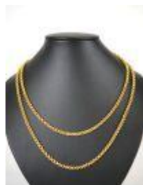
654. Probable chaîne giletère pouvant former collier sautoir en or jaune 18K à maille annulaire. Poids : 26,3 g. L. 146 cm.