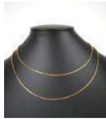
650. Collier en or jaune 18K à maille vénitienne. Poids : 9,6 g. L. 69 cm.