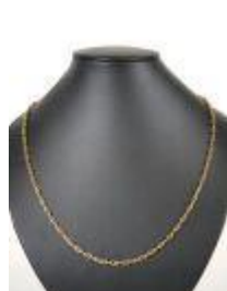
655. Chaîne de cou en or jaune 18K à maille chaîne d'ancre stylisée dans le goût d'Hermès. Poids : 6,6 g. L. 50 cm.