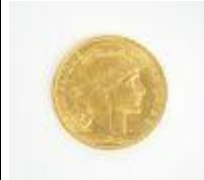
458. Pièce de 20 francs en or, Marianne, 1908. 300 / 400 €