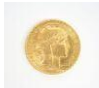
459. Pièce de 20 francs en or, Marianne, 1913. 300 / 400 €