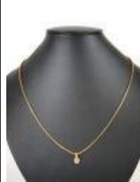
658. Collier en or jaune 18K à maille vénitienne stylisée orné d'un petit diamant rond de taille brillant, d'environ 0,15 carat monté en serti-clos. Poids brut : 8,1 g. L. 44 cm.