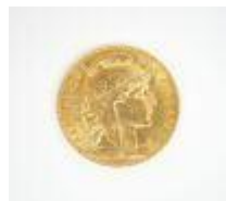
445. Pièce de 20 francs en or, Marianne, 1913. 300 / 350 €