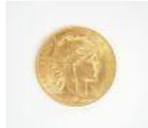
449. Pièce de 20 francs en or, Marianne, 1910. 300 / 350 €