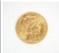
456. Pièce de 20 francs en or, Marianne, 1911. 300 / 350 €