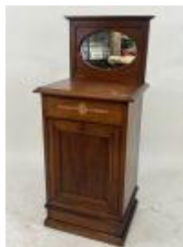
199.18. Chevet barbière en acajou mouluré ouvrant par un abattant en partie basse, la partie supérieure à fond de glace. Style anglais. 109 x 47,5 x 40,5 cm. (fente plateau, à refixer).