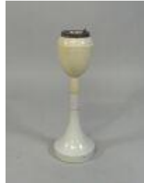
137. Cendrier en plastique blanc et métal. Travail italien XXe. H. 52 cm. (plastique jauni en partie supérieure).