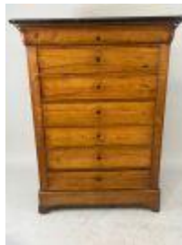
146. Semainier en bois mouluré, dessus de marbre noir. 147 x 109 x 50 cm. (fentes).