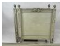
42. Lit en bois laqué et mouluré à décor au nœud. Style Louis XVI. 90 x 180 cm. (usures, petits accidents).