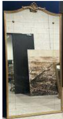
199.07. Très important miroir en bois et stuc doré surmonté d'une coquille. 210 x 110 cm.