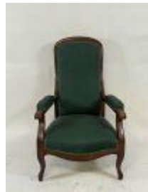
199.1. Fauteuil en bois mouluré, la garniture en tissus vert. 108 x 68 x 75 cm.