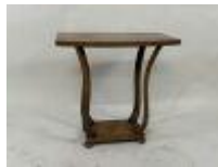
199.13. Petite table en bois mouluré. De style 1930. 64 x 65 x 38 cm.