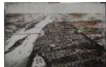
199.08. Vues de Tours. Lot de deux reproductions. 172 x 270 cm et 172 x 274 cm.