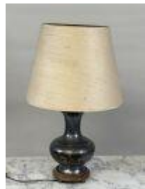
136. VIETNAM, XXe. Lampe en étain et laiton à décor de dragons. H. 72 cm avec l'abat-jour.