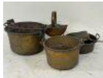
199.14. Lot de cinq éléments en cuivre, laiton et métal comprenant : - grand chaudron (34 x 53 x 48 cm), - bassinoire, casserole, etc... (usures).