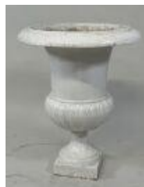
139. Vasque de jardin en fonte peinte à décor godronné. H. 70 cm. D. 55 cm.