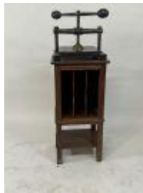
144. Presse en fonte. Présentée sur son meuble en chêne mouluré compartimenté. 100 x 37 x 33 cm.