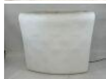
32. NEW GARDEN. Bar d'extérieur éclairant en plastique blanc. 110 x 114 x 60 cm. (non testé, usures).