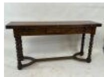
199.11. Table console en bois mouluré à plateaux dépliant ouverts par un tiroir. De style rustique. 80 x 160 x 40 cm (repliée).