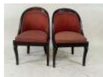
199.09. Paire de chaises gondoles en acajou, la garniture en tissus. 78 x 50 x 40 cm.