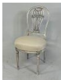
36. Chaise en bois mouluré, le dossier à décor d'une montgolfière, l'assise en tissu. Style LOUIS XVI. 92 x 46 x 42 cm.