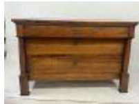
145. Commode à colonnes détachées en bois mouluré ouvrant par trois tiroirs. XIXe. 85 x 131 x 62 cm. (fentes).