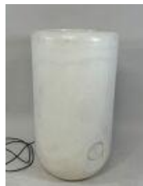
34. NEW GARDEN. Grande jardinière éclairante haute en plastique. H. 107 cm. D. 59 cm. (usures, non testée).