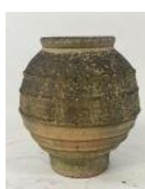
141. Grande jarre en terre cuite. H. 59 cm.