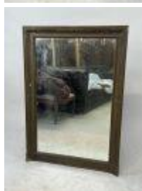
45. Miroir rectangulaire en bois et stuc doré à décor de palmettes stylisées et feuillages. 108 x 75 cm. (accidents et manques).