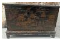
199.2. CHINE, XIXe. Grand coffre en bois laqué et doré à décor de scènes animées. 94 x 140 x 60 cm. (fentes, accidents, manques).