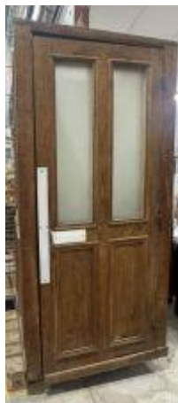
39. Eugène FILIOL. Grande cabine téléphonique en bois mouluré et verre ouvrant par une porte. Porte une étiquette à l'intérieur. 215 x 101 x 100 cm. (accidents et manques).