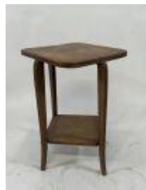
199.04. Petit guéridon en bois mouluré à plateau d'entretoise. 62 x 53 x 53 cm. (taches d'eau).