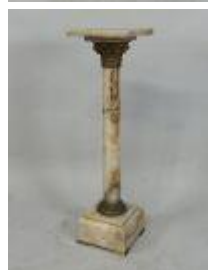
37. Colonne onyx et bronze, la base carrée, le fut colonne, la partie haute en chapiteau feuillagé. 103 x 28,5 x 28,5 cm. (plateau restauré).