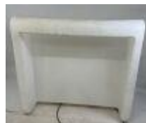
35. NEW GARDEN. Bar d'extérieur éclairant en plastique. 110 x 120 x 57 cm. (non testé, usures).