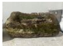
30. Auge en pierre avec déversoir. 32 x 72 x 35 cm.