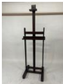
142. Grand pupitre de peintre en bois teinté, réglable en hauteur. 230 x 53 x 50 cm (au plus haut).