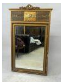
44. Miroir trumeau en bois et stuc doré à décor d'un profil de femme. 126 x 75 cm. (accidents, manques et restaurations).