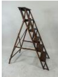
147. Escalier de bibliothèque en bois à six marches. 133 x 40 x 100 cm (déplié).