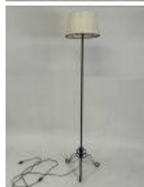
38. Lampadaire en métal laqué noir. Électrifié. H. 154 cm. (usures abat-jour).