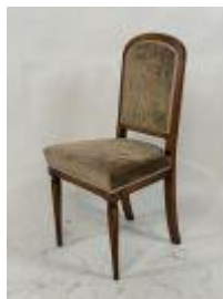
199.12. Chaise en bois mouluré, les pieds fuselés. Années 1930. 92 x 46 x 44 cm.