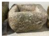
31. Auge en pierre. 33 x 49 x 40 cm.