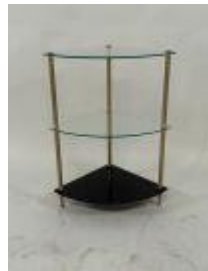
199.06. Étagère encoignure en verre et laiton à trois niveaux (deux translucides, un noir). 73 x 38 x 54 cm.