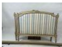
43. Lit en bois laqué, mouluré et sculpté à décor de rangs de perles, la garniture en tissu bleu et blanc rayé. Style Louis XVI. 110 x 195 cm. (usures, petits accidents).