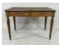
199.16. Petit bureau plat en bois mouluré ouvrant par deux tiroirs, dessus en simili-cuir. De style Louis Philippe. 75 x 110 x 64 cm.