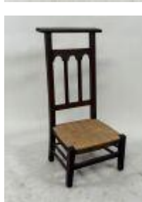
199.17. Prie-Dieu en bois et paille. 87 x 43 x 37 cm.