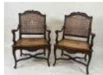
138. Paire de fauteuils en bois mouluré et sculpté, le dossier et l'assise cannés, la traverse en X. 98 x 64 x 50 cm. (accidents au cannage).