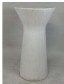
33. NEW GARDEN. Guéridon haut en plastique blanc. H. 110 cm. D. 60 cm. (usures).