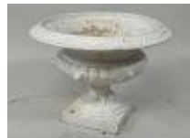
140. Vasque de jardin en fonte peinte à décor godronné. H. 37 cm. D. 51 cm.