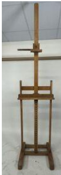
143. Grand pupitre de peintre en bois clair, réglable en hauteur par crémaillère. 230 x 53 x 50 cm (au plus haut).