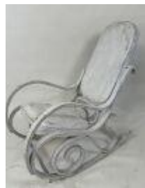
134. Rocking-chair en bois courbé, la garniture en simili-cuir peint. 95 x 55 x 90 cm. (accidents).