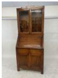
199.19. Buffet de pente en bois mouluré ouvrant par un abattant, deux tiroirs, deux portes. La partie supérieure ouvrant par deux portes vitrées. Vers 1900. 185 x 78 x 47 cm. (abattant fermé bloqué, avec deux clés).