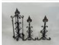
41. Importante paire de chenets et accessoires sur support au modèle en fonte et métal. 72 x 40 x 52 cm (chenets). H. 91 cm (support).