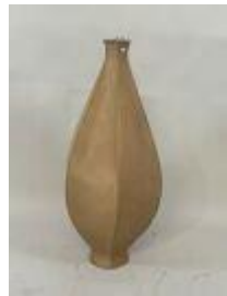
199.05. Lampe ou lampadaire à poser en tissu et métal. H. 108 cm.