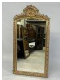
40. Grand miroir en bois et stuc doré à décor feuillagé, le fronton à coquille stylisée. 148 x 78 cm. (accidents et manques).