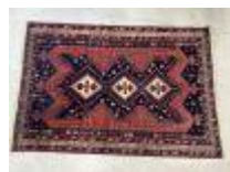
66. Important tapis en laine nouée main à décor stylisé bleu et rouge. 198 x 135 cm. (léger accident de trame).