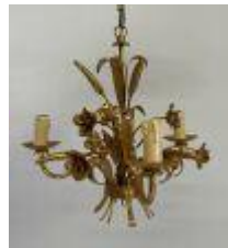
61. Lustre en métal doré à trois feux de lumière à décor d'épis de blé et fleurs. H. 36 x Diam. 40 cm.