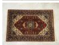
64. Tapis en laine nouée main à décor stylisé sur fond marron. 198 x 135 cm. (légères usures au centre).