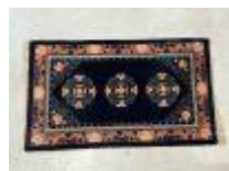
65. CHINE, XXe. Tapis en laine nouée main à décor stylisé rose sur fond bleu. 154 x 92 cm.