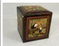
73. Pouf africain en cuir polychrome à décor toutes faces de toucans et perroquets. 42 x 42 x 42 cm.