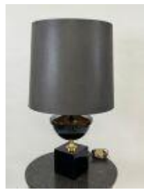
60. Lampe en métal laqué noir et doré. Années 70. H. 76 cm.