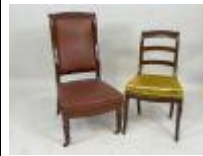
70. Chauffeuse en acajou mouluré, la garniture en simili-cuir rouge. 96 x 50 x 50 cm. On y joint une chaise en acajou (garniture assise usée).