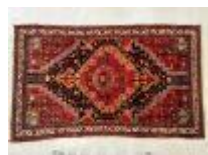
68. IRAN, XXe. Tapis en laine nouée main à décor stylisé sur fond rouge. 204 x 124 cm.