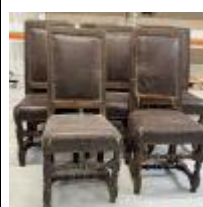
71. Série de huit chaises en bois mouluré et tourné, les assises et dossiers en cuir, les entretoises en X. 103,5 x 45 x 41 cm. (accidents, usures, manques, renforts).