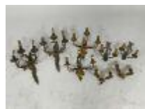
62. Quatre paires d'appliques en bronze, laiton et métal doré à trois ou deux feux de lumière à décor de lyre, feuillages et fleurs. H. 46 cm (la plus grande). (petits manques).