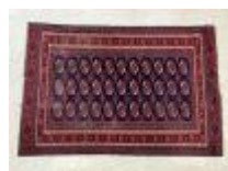
67. IRAN, XXe. Tapis en laine nouée main à décor stylisé bleu sur fond rouge. 183 x 122 cm. (usure de trame).