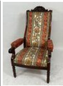
69. Fauteuil Voltaire en acajou mouluré et sculpté, garniture de tissu ocre et fleuri. 118 x 72 x 80 cm.