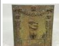
72. Plaque de cheminée en fonte à décor d'un enfant tenant une jarre et les côtés ornés de cariatides, des pots fleuris sur la tête reliés par une guirlande feuillagée. 54 x 50 cm.