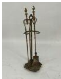
63. Nécessaire de cheminée en bronze comprenant pelle et pincette, les prises en forme de pomme de pin. H. 72 cm sur le support.