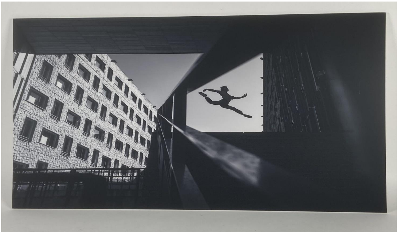
Une photo de Yanis Ourabah mise en vente entre 300 et 450 €.

Sur place ou en ligne , à partir de 14 h, quatre-vingt-quinze lots seront proposés. Parmi eux, une vingtaine de dessins ou maquettes estimés de 10 à 100 € au départ. Une dizaine de photos, de 30 à 450 €. « Il y en a de Yanis Ourabah, un photographe basé à Lyon qui prend en photo les danseuses dans des formes urbaines. Nous avons aussi des clichés d'une photographe ukrainienne basée à Berlin, Mariia Kulchytska, et d'une photographe espagnole de Barcelone, Lucia Garcia », reprend le président.