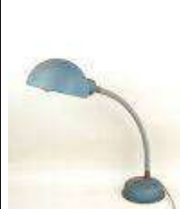
297. Lampe industrielle en métal, la bras flexible. Travail des années 50/60. H.: 42 cm. (usures).