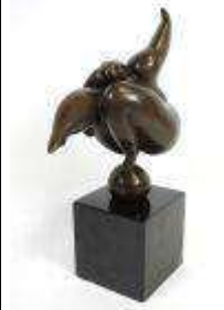
215. MILO (XXe). Femme acrobate sur boule. Sujet en bronze à patine brune signé, sur socle cubique en marbre noir. H.: 26 cm.