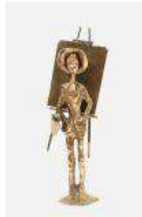
211. Yves LOHE (1947). Le peintre. Sculpture en bronze patiné signée au revers. H. : 37 cm.