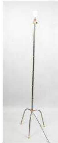
293. Pied de lampadaire en métal et métal doré, reposant sur trois pieds. Travail des années 80. H.: 150 cm.