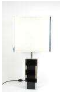
289. Lampe de table en bois laqué et angle en métal chromé. Travail des années 80/90. H.: 74 cm. (petites usures).