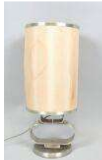
290. Lampe en inox sur socle circulaire. Travail des années 80. H.: 50 cm.