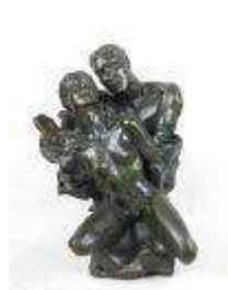
214. Nathalie SOUSSAN MORIN (XXe). Couple entrelacé. Groupe en bronze à patine, signé et numéroté A03. 50 x 40 x 34 cm environ.