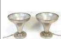
295. LUMINATOR FRANCAIS. Paire de lampes à poser en métal chromé de forme tulipe. Travail des années 30/40. H.: 21 cm. (chocs).