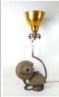
292. Lampe en fer forgé composée de deux vases en grès difformes. Travail des années 80/90. Abat-jour en métal doré. H. : 77 cm.