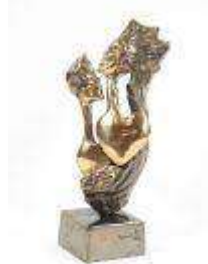
212. Yves LOHE (1947). Les amoureux. Sculpture en bronze patiné signée sur la terrasse. H. : 27 cm.