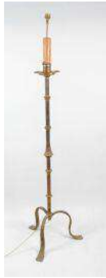
287. Lampadaire en fer forgé à piétement tripode, anciennement laqué doré. Travail brutaliste du XXe. H.: 165 cm. (oxydation).