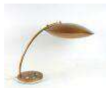
291. Lampe de bureau en métal laqué doré. Abat-jour en forme de sphère aplatie. Travail des années 70. Diam.: 39 cm. (usures).