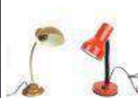
296. Deux lampes en métal dont une rouge et une marron, le fût flexible. Travail des années 70/80. H.: 37 et 39 cm. (choc sur la base de la marron).