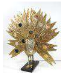
221. FONDICA. Lampe en métal doré formant un paon, la queue à décor de tranche d'agate. Base rectangulaire en onyx noir. 76 x 70 x 35 cm.