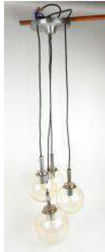
288. Suspension liane à quatre boules de verre, monture en métal chromé. Travail des années 80/90. H.: 120 cm.