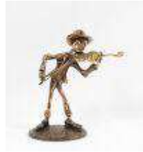
210. Yves LOHE (1947). Le violoniste. Sculpture en bronze patiné, signée sur la terrasse. H.: 24,5 cm.