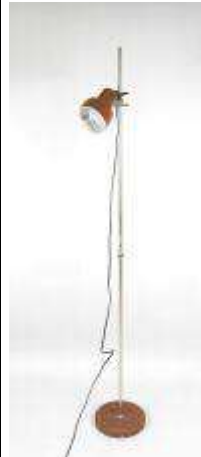
294. Lampadaire, le fût en métal chromé, l'abat-jour et la base en métal laqué marron. L'abat-jour réglable. Travail des années 70. H.: 152 cm. (oxydation et chocs).