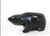
216. BOMA. Ours polaire. Sujet en résine noire signé. 5.5 x 11 x 4,5 cm.