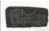
219. Plaque en ardoise gravée de motifs abstraits. 7 x 15 cm.