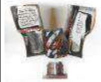
218. Yolande TANCHOU (XXe). Triptyque en bois peint à décor de textes. Signé au revers sur le plus petit, et daté 87. 54 x 26 x 10 cm. 31 x 23 x 5 cm. Provenance : Exposition au château d'Amboise de 1991. On y joint le catalogue d'exposition.