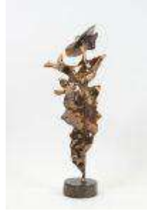
209. Yves LOHE (1947). La femme aux oiseaux. Sculpture en bronze patiné signée sur la terrasse. H. : 34,5 cm.