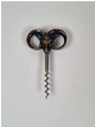
92. Mogens BALLIN. Tire-bouchon simple d'origine danoise, la poignée en bronze patiné représentant une tête de capricorne, la mèche coupante. Vers 1930.