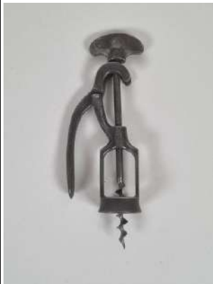
217. Moïse COVILLE. Tire-bouchon d'origine française de type mono-levier appelé "Le Rapide", la mèche coupante. Vers 1900.