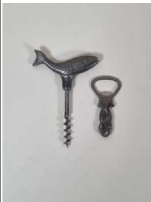
98. Just ANDERSEN. Tire-bouchon simple d'origine danoise, la poignée en étain représentant un saumon, la mèche coupante. Marqué DANMARK Vers 1930. On y joint un petit décapsuleur en étain à décor de poissons entrelacés.