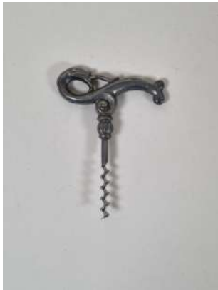
90. Just ANDERSEN. Tire-bouchon simple d'origine danoise, la poignée en étain représentant Nessie, le monstre du Loch Ness, la mèche coupante. Marqué ROSTFRITT. Vers 1930.