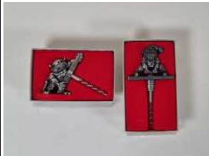
95. TINN-PER. Lot de deux tire-bouchons simples d'origine norvégienne, les poignées en étain représentant un viking, la mèche coupante. Marqués TINN-PER NORWAY. Présenté dans leur emboîtement d'origine. Fin XXe.