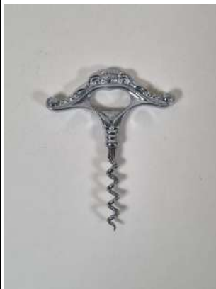
99. GERO. Tire-bouchon simple d'origine danoise, la poignée en métal en forme de bicorné ajouré en ovale représentant la gueule d'un monstre, les extrémités en volute, la mèche coupante. Vers 1930.