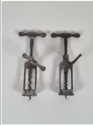
213. Lot de deux tire-bouchons d'origine française de type crémaillère dont : * Jean batiste BOUÉ. Marqué sur la cage JB dans une étoile. * Amédée BOILEAU. Marqué sur la cage AP PARIS dans un ovale. Vers 1900.