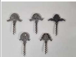
96. C.A PERSSON (designer) et Herman BERGMAN (fondeur). Lot de cinq tire-bouchons figuratifs d'origine suédoise en étain, les mèches coupantes. Marqués CAP. Vers 1930.