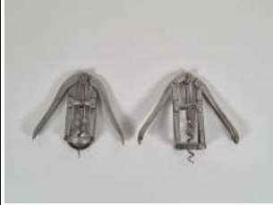
216. Lot de deux tire-bouchons à deux bras de levier en tôle découpée et emboutie assemblé par rivets dont : * Alexandre BOY. Marqué PRATIC BOY-SCOUT MARQUE DEPOSE, la mèche ronde. * Placido VOGLIOTTI. Marqué BREVETTI VOGLIOTTI TORINO, la bague d'appui pliante, la mèche coupante. Début XXe.