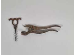
209. Tire-bouchon et sa pince à débouchonner en acier d'origine anglaise. La pince marquée THE TANGENT LEVER sur chaque face, le tire-bouchon à mèche ronde marqué THE LEVER SIGNET sur chaque face. Breveté par William LUND et William HIPKINS le 2 avril 1855 sous le n°756. Fin XIXe.