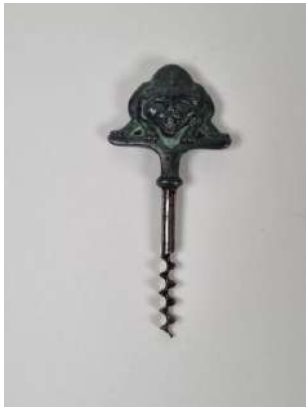
93. Tire-bouchon simple d'origine suédoise, la poignée en bronze à patine verte représentant un jaguar rugissant de face, la mèche coupante. Vers 1925.