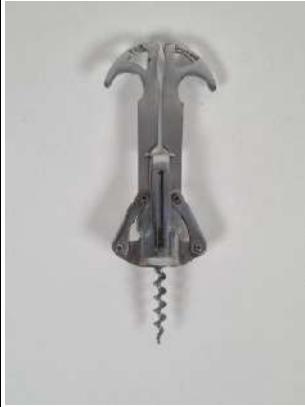
215. Henry PARAF. Tire-bouchon d'origine française de type deux bras de levier en tôle découpée et emboutie assemblée par rivets, la mèche coupante. Marqué TYR. Vers 1900.