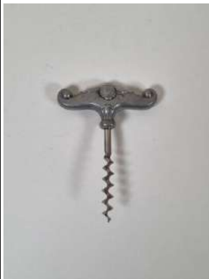
97. Tire-bouchon simple d'origine scandinave, la poignée en étain à décor de feuillages les extrémités terminées en volute, la mèche coupante. Vers 1930.