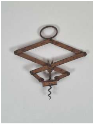
208. John HEELEY & SONS. Tire-bouchon extensible d'origine anglaise à deux bras, la mèche ronde. Marqué HEELEY'S ORIGINAL PATENT THE PULLEZ. Vers 1900.