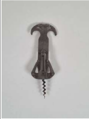
214. Henry PARAF. Tire-bouchon d'origine française de type deux bras de levier en tôle découpée et emboutie assemblée par rivets avec agrafe sur le manche, la mèche coupante. Marqué ALPA Breveté S.G.D.G. Vers 1900.