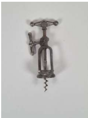
212. Jacques PÉRILLE. Tire-bouchon à crémaillère en acier, la tête ornée de deux boules et ajourée d'un cercle couronné, la poignée en forme d'hélice, la mèche coupante. Marqué sur la tête J.PÉRILLE d'un côté et J-P de l'autre. Modèle breveté le 8 juillet 1879. Vers 1900.