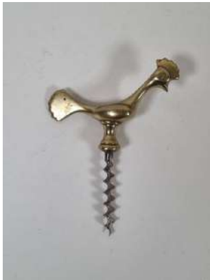
91. Tire-bouchon simple d'origine suédoise, la poignée en métal doré représentant un coq de style art déco, la mèche coupante. Vers 1930.