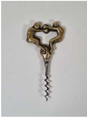
94. Mogens BALLIN. Tire-bouchon simple d'origine danoise, la poignée en métal doré représentant un satyre et un personnage masculin se disputant une grappe de raisin, la mèche coupante. Vers 1930.